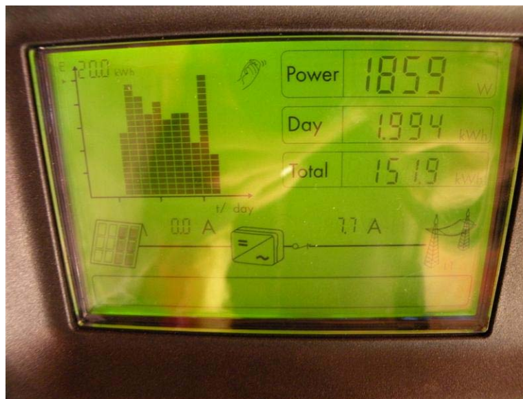
Malá fotovoltaická elektrárň, 4,5 kWp v Novej Lesnej (P. Zaťko)